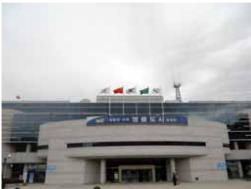
图 3 南扬州市府为迎接常州友城代表团升起了五星红旗

南扬州市位于韩国首都首尔东北部的京畿道,清澈的北汉江穿城而过,面积 460km 2 ,人口 51 万,1999 年 9 月 21 日与我市结为友好城市(图 3)。南扬州市政府机构比较精简,市级层面只有正副市长各一人,下面共有 6 位局长,机构和人员设置也许能反映他们的“小政府”格局吧。