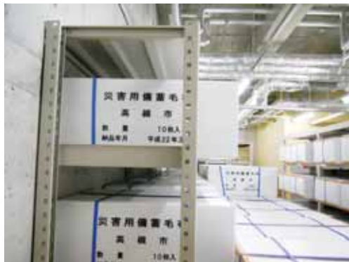
图2 防灾体育馆地下储藏室内的防灾物资

在高槻市,正逢樱花盛开,代表团参观了刚刚于今年新落成的关西大学高槻校区。校区包括关西大学社会安全学部(相当于大学的系)的本科部和研究生院,以及所附属的中学、小学和幼儿园。从学前教育到研究生教育,集中在一个校区,可能算高槻市教育领域的一种特色吧。关西大学社会安全学部河田部长表示,现在在日本,社会安全问题非常令人关注,如1995年阪神大地震,还有铁路事故、甲流以及丰田汽车召回事件等等,所以关西大学成立了社会安全学部及研究院,为社会培养高层次的处理各种突发、紧急事件的人才。代表团还参观了新近落成的高槻防灾体育馆和防灾公园,该体育馆和公园平时用作市民开展