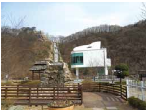
图 5 南扬州市的“钢琴卫生间”污水处理厂

在南扬州市,代表团还参考察了名为“钢琴卫生间”的污水处理厂。从厂名来看,就很有艺术性,人造高山瀑布、乳白色钢琴造型的标志性建筑卫生间,园林式的厂区……无不给人以美感而难以与“污水处理”相联系(图 5)。主人用 PPT 投影向代表团详细介绍了该厂污水处理的工艺流程和效果,带领代表团参观了工厂先进的设施。该厂不仅能处理生活污水,还能处理人畜粪便,日处理量达 4.3 万吨,经物理、化学和生物手段处理净化过的水用来灌溉、冲地、做瀑布景观再进入河道,整个处理过程约 12 个小时。该厂还是市民和学生的科普和环境教育基地,每年要接待 15 万来访者。